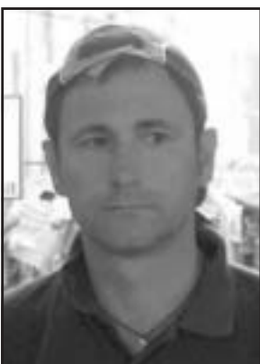
Il regista Vittorio Vespucci . A sinistra, la prima sequenza del trailer del docufilm sull'inquinamento industriale

sente anche un orientamento volto alla speranza e alla fiducia nell'avvenire: alla fine del corto, il destino della Taranto futura si percepisce dalle parole di una bambina che scrive una lettera fiduciosa al patrono della città». Quando è iniziata e come si è evoluta l'idea del documentario collettivo? «Il progetto è iniziato circa otto mesi fa. Sono state attraversate diverse fasi. La prima, da novembre 2007 a febbraio 2008, ha previsto la pubblicizzazione dell'idea e la raccolta dei vari contributi