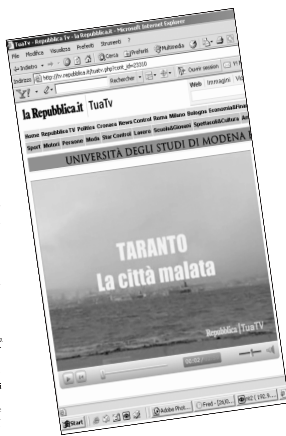
La pagina del sito di Repubblica.it/tuatv con in primo piano l'immagine